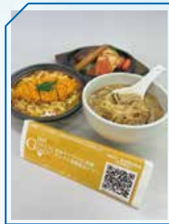
食品サンプル認識AIアプリ