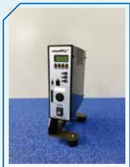
配線不要のコンパクトなPLC