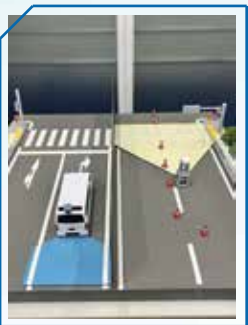
道路標示施工を自動化するシステム